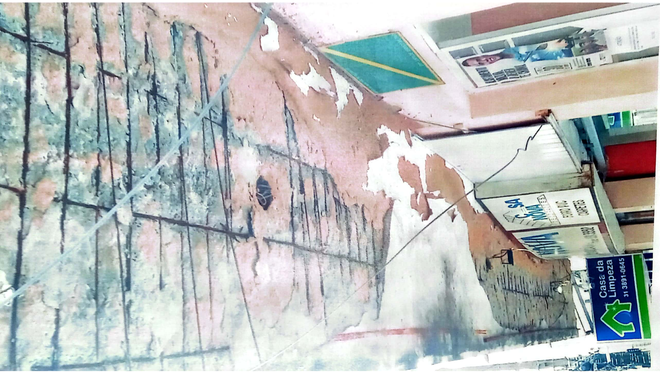
RUA DR. MILTON BANDEIRA, Nº 125. BAIRRO CENTRO